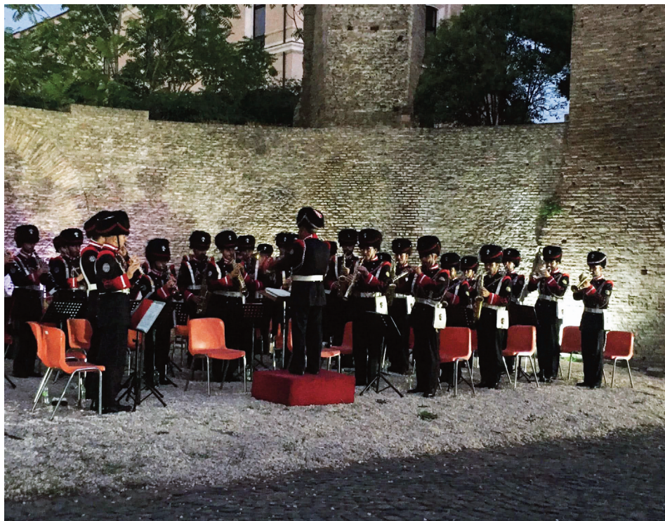
La Musica d'ordinanza del 1° Reggimento “Granatieri di Sardegna”