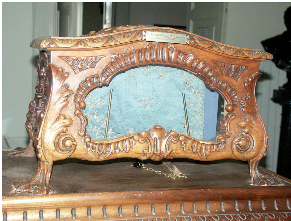
Cofanetto, custodito presso il Museo Storico dei “Granatieri di Sardegna”, contenente i fascicoli dell’atto notarile relativo al lascito del Duca di San Pietro.

Tra queste, la celebrazione della Messa Solenne in armi in suffragio di Don Alberto Genovese Duca di San Pietro con il relativo godimento del lascito di cui la musica d'ordinanza dei Reggimenti appare la principale beneficiaria.